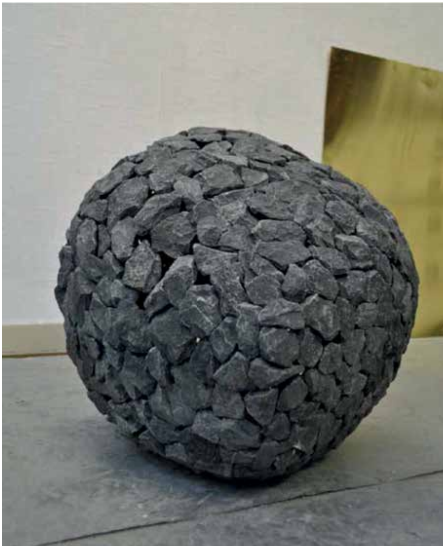
Sans titre, petit granit, 2011, h : 49 cm

est si simple, si élémentaire qu'il ramène les sensations produites à de valeurs purement physiques, à des manifestations de l'être plutôt qu'à des expressions culturelles. La forme est là, certes, mais sans bavardage, souvent dictée par des assemblages, ou si élémentaire qu'elle évoque plutôt les prémices de l'humanité. Il résulte de cet affranchissement vis-à-vis du langage formel, une puissance et une séduction silencieuses, qui nous communiquent aussi un sentiment de liberté, une conscience rafraîchie d'exister dans le monde, parmi les matières, nous-mêmes traversés et régis par la gravité. Car nous éprouvons ces sculptures autant que nous les contemplons : nous appréhendons leur rugosité, elles imposent leur masse, les imbrications de leurs matières nous intriguent, nous nous projetons dans leur poids, l'effort accompli pour les mettre en place participe même à leur présence et la fascination qu'elles exercent. Dans ses œuvres récentes, en assemblant des pierres autour d'un vide, par les artifices de la technique, Robin Vokaer retrouve le même propos par une autre voie, en même temps qu'il nous soumet une sorte